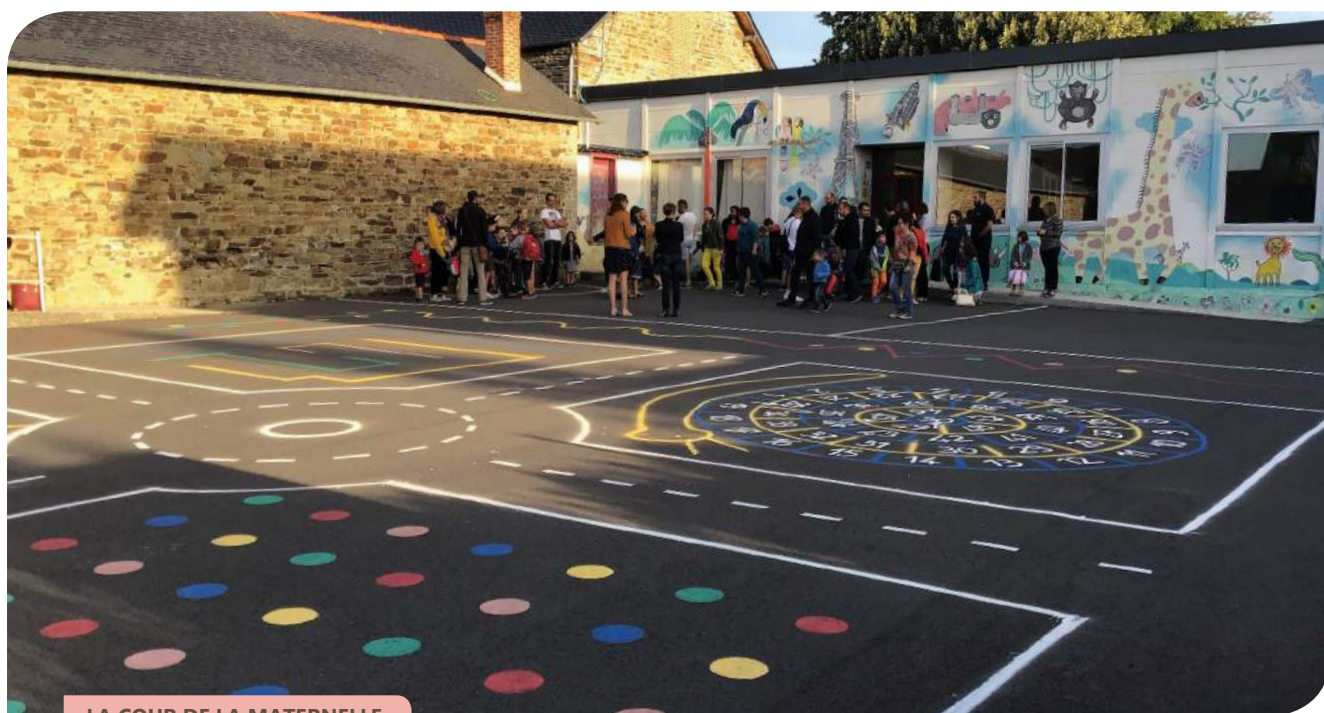
LA COUR DE LA MATERNELLE

La cour bitumée de la cour maternelle a été joliment décorée par Caroline et Laurence pendant l'été. L'inauguration a eu lieu le jour de la rentrée. L'APEL a offert un bouquet de fleurs à chacune pour les remercier de ce bel embellissement. Des tracés de jeux (Twister, marelle, terrain de foot,...) font le bonheur des enfants de la maternelle.