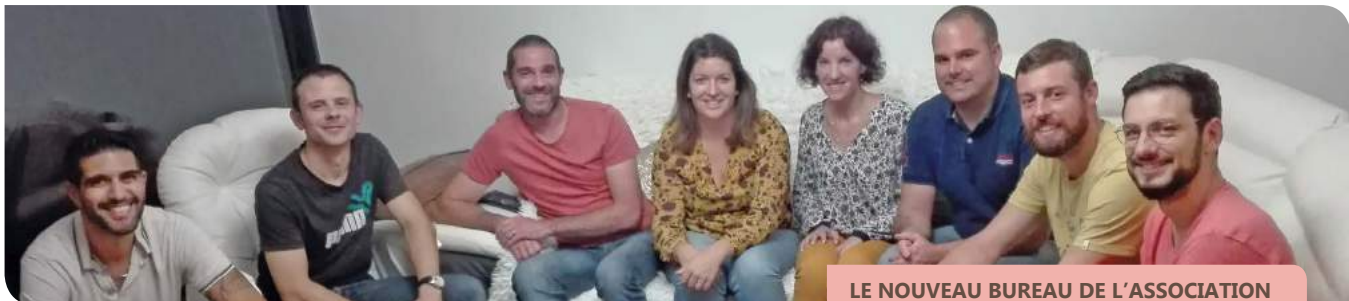
LE NOUVEAU BUREAU DE L'ASSOCIATION